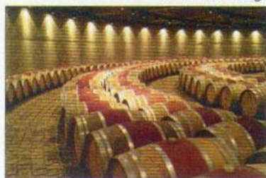
De cette cave sortent environ 20 millions de litres de vin par an.

Catena Zapata, troisième du nom à diriger ce vignoble, l'un des plus grands du continent. Au creux des flancs chaulés de la pyramide tronquée se trouvent une impressionnante cave circulaire remplie de barriques de chêne, les celliers nichés dans l'ombre fraîche des chambres de pierre, et des salles de dégustation éclairées par une verrière zénithale. La plus excentrique bodega d'Amérique du Sud