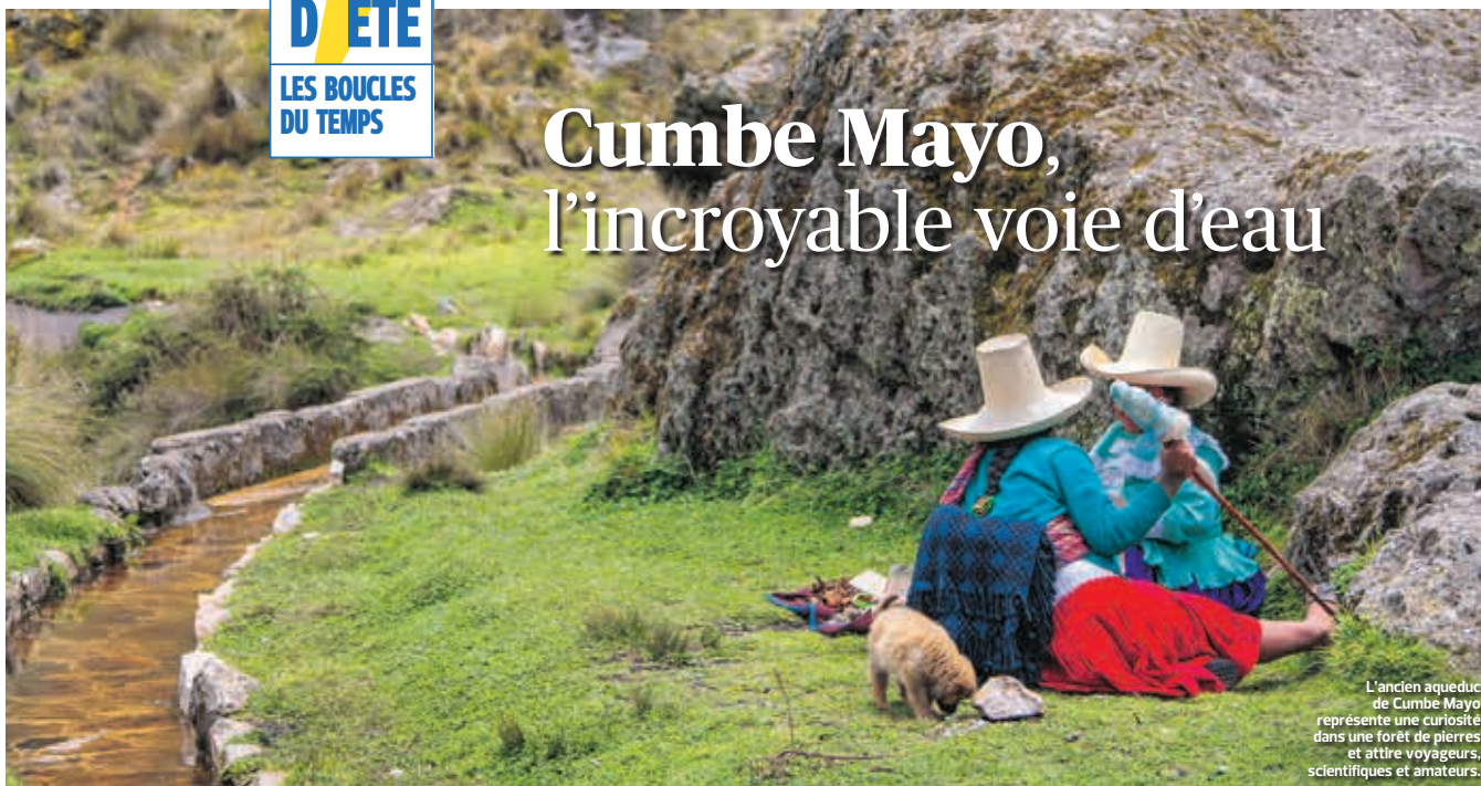
L'ancien aqueduc de Cumbe Mayo représente une curiosité dans une forêt de pierres et attire voyageurs, scientifiques et amateurs.