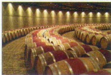
De cette cave sortent environ 20 millions de litres de vin par an.

Catena Zapata, troisième du nom à diriger ce vignoble, l'un des plus grands du continent. Au creux des flancs chaulés de la pyramide tronquée se trouvent une impressionnante cave circulaire remplie de barriques de chêne, les celliers nichés dans l'ombre fraîche des chambres de pierre, et des salles de dégustation éclairées par une verrière zénithale. La plus excentrique bodega d'Amérique du Sud